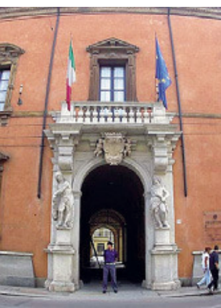
Prefettura Sit-in il 19.

La manovra così com'è non è equa: a pagare sono sempre gli stessi, lavoratori, pensionati e ceti medi. Il pubblico impiego per primo. Per questa ragione lunedì 19 si terrà lo sciopero nazionale dei lavoratori dei servizi pubblici, indetto unitariamente da Fp-Cgil, Cisl-Fil, Uil-Fpl e Uil-Pa, per l'in-